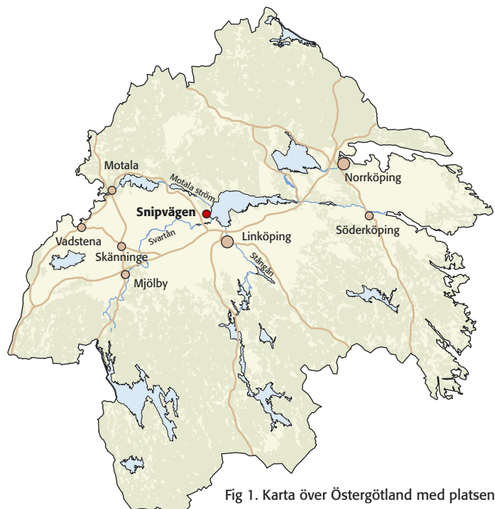
Fig 1. Karta över Östergötland med platsen för den antikvariska kontrollen markerad.