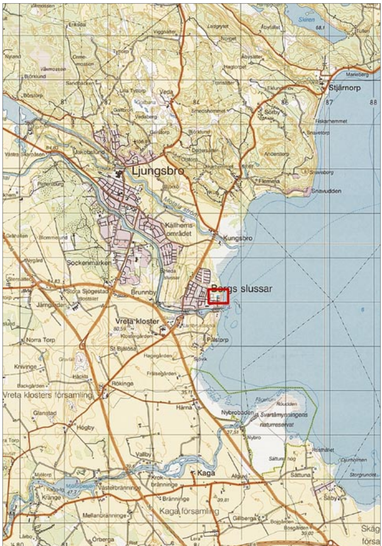
Fig 2. Topografiska kartan med platsen för den antikvariska kontrollen markerad. Skala 1:50 000.