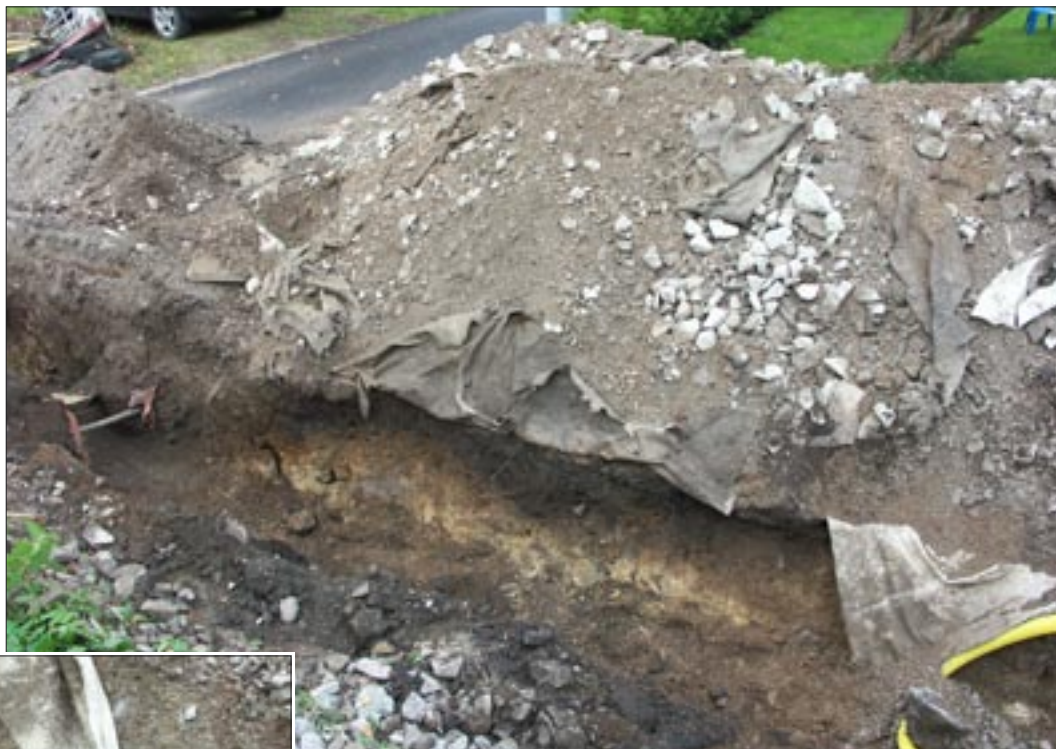
Fig 4. Kulturlagret och en härd i schaktkanten.