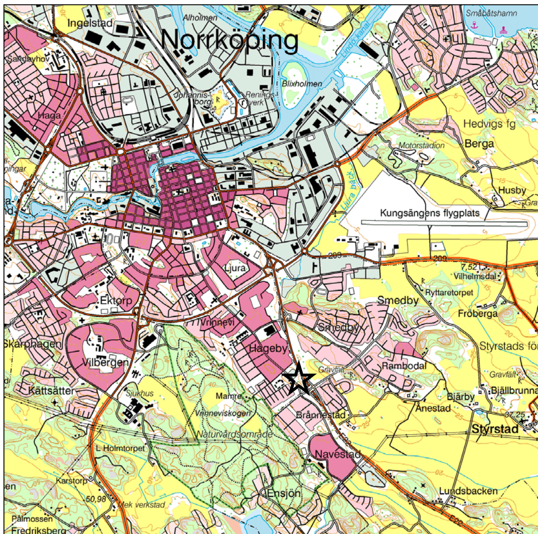
Fig 1. Utdrag ur Gröna Kartan med platsen för förundersökningen markerad.