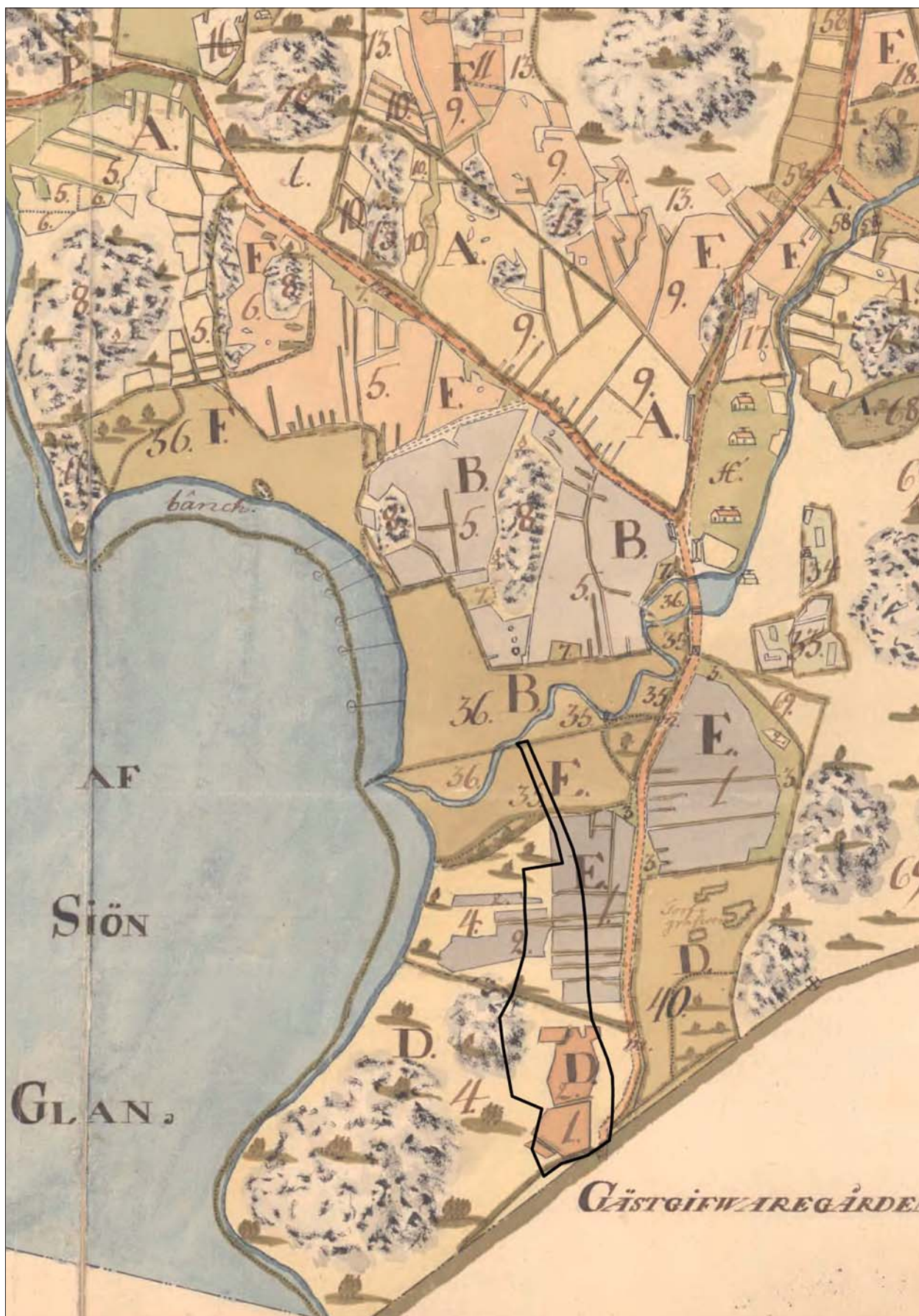
Figur 4. Utsnitt ur 1760 års ägomätning med utredningsområdet markerat (LMS D84-92:1).