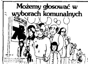
ABC om VAL (invandrarverket)