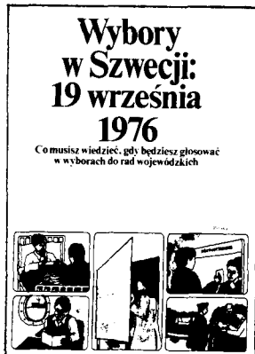
Wybory w Szwecji (riksskatteverket)