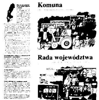
Informacja dla imigrantów (landstinget)