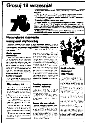
Specjalny dodatek o wyborach w