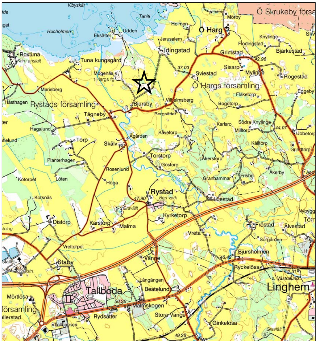
Fig 1. Utdrag ur Gröna Kartan med platsen för undersökningsområdet markerad.