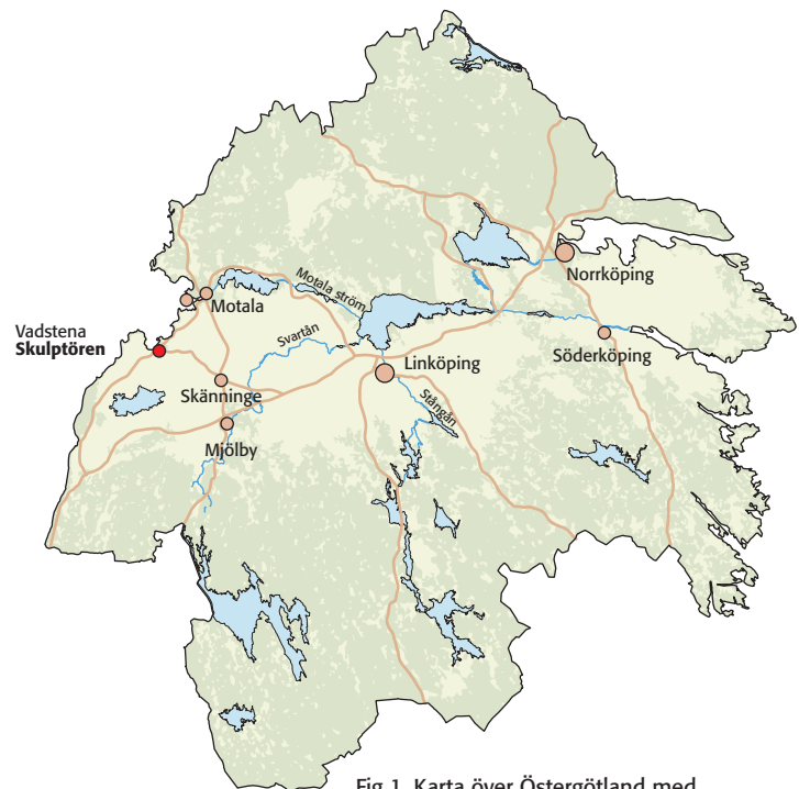
Fig 1. Karta över Östergötland med platsen för undersökningsområdet markerad.