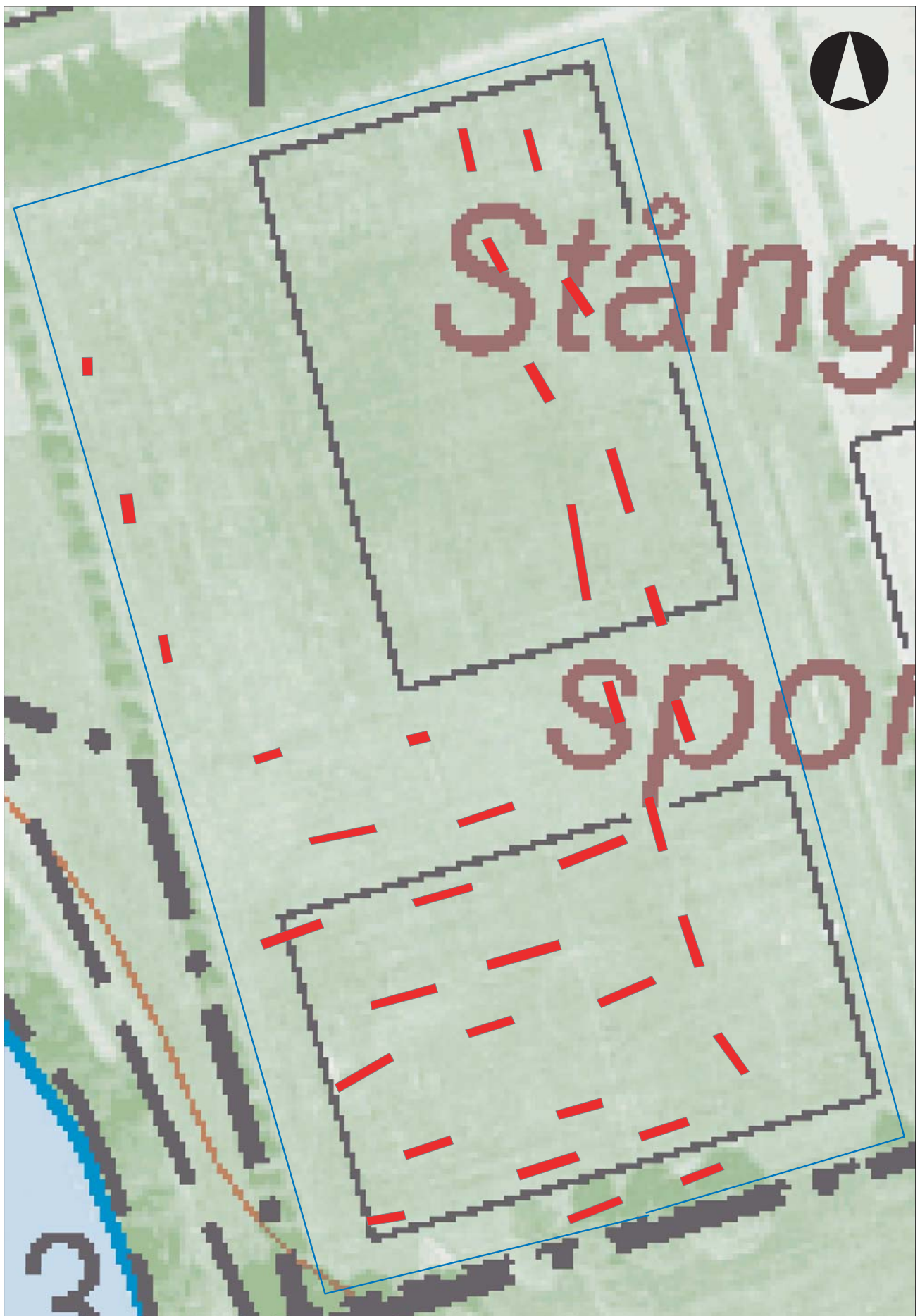
Figur 3 Utdrag ur Fastighetskartan med området och sökschakten markerade. Skala 1:1 000.