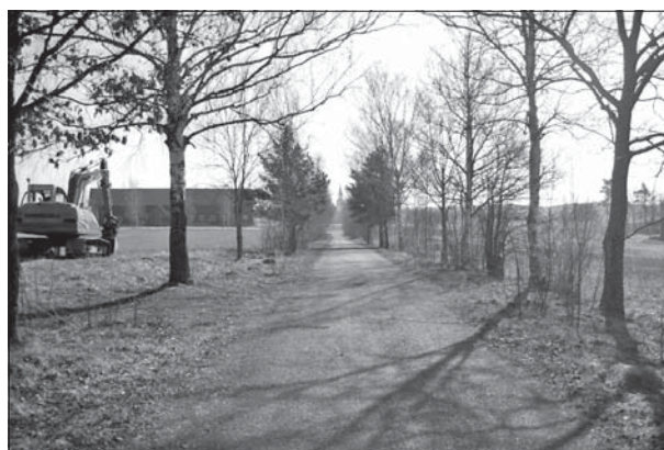
Figur 3. Allén från väster.

Larsson M. 1997. Arkeologisk förundersökning. Stugby vid Viby. Risinge socken, Finspångs kommun, Östergötland . Riksantikvarieämbetet. Avdelningen för arkeologiska undersökningar, Rapport UV Linköping 1997:14.