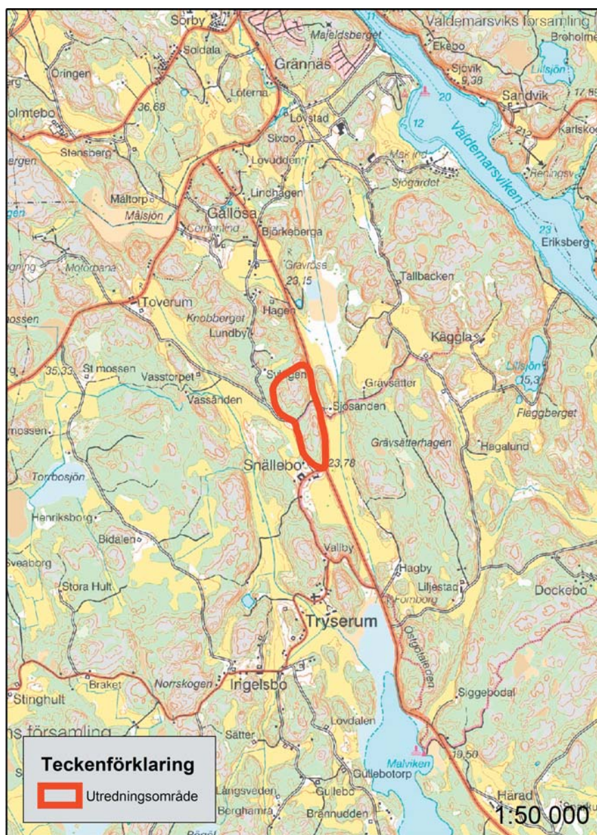
Figur 2. Utdrag ur Topografiska kartan över Snällebo med undersökningsområdet markerat.

I närområdet finns ett antal fornlämnningar registrerade. Dessa utgörs i huvudsak av ensamliggandestensättningar, men det finns även skärvstenshögar och ett gravfält. I Riksantikvarieämbetets forminnesregister finns enstensättning, RAÄ 360, inom området för utredningen.