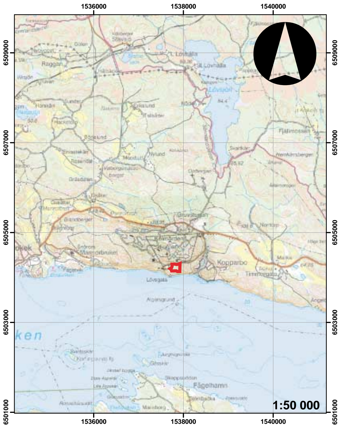
Figur 2. Utdrag ur Topografiska kartan med utredningsområdet markerat.

Östergötlands länsmuseum utförde 2002-03-19 en arkeologisk utredning etapp 1 vid Marmorbrottet, Krokek socken, Norrköpings kommun. Utredningen föranleddes av planerad bebyggelse med campingstugor. Området är känsligt ur miljöhänseende. Platsen för den planerade stugbyn låg inom ett område klassat som särskilt intressant för naturmiljön. Vidare är Fagervik-Marmorbruket klassat som riksintressant kulturmiljö av