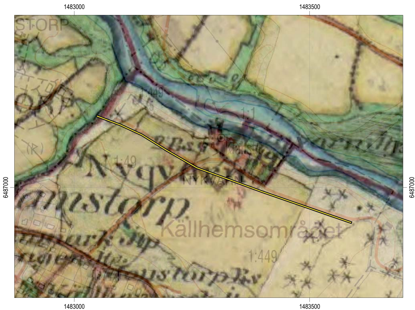
Figur 3. Utdrag ur den rektifierade Häradskartan, blad Roxen, med utredningsområdet markerat. Skala 1:5 000.