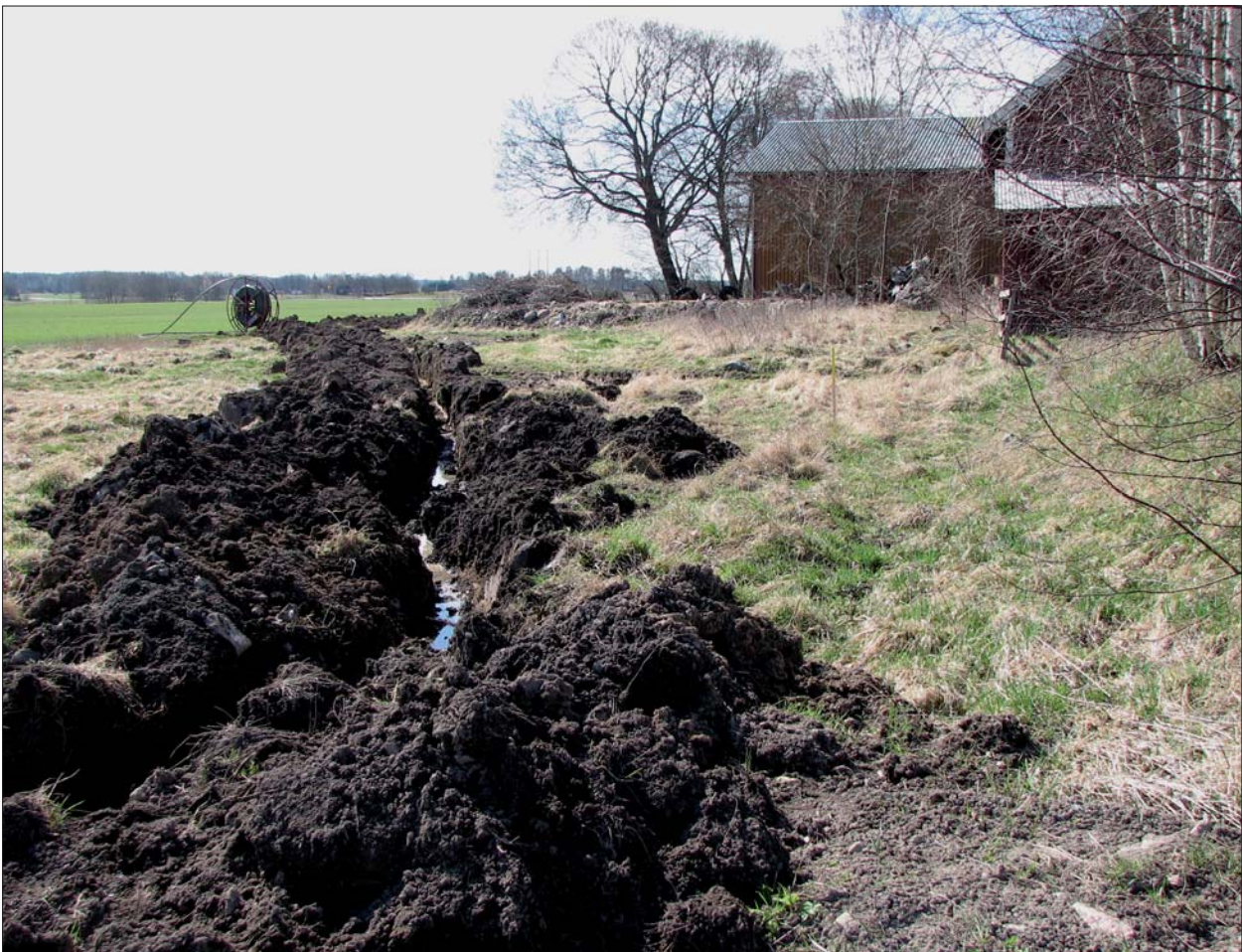
Figur 4. Schaktsträckningen i den södra delen av Bankebergs bytomt (RAÄ 232). Från väster.

05-VIK-75 Lantmäterimyndigheternas arkiv Lagaskifteskarta från 1846.