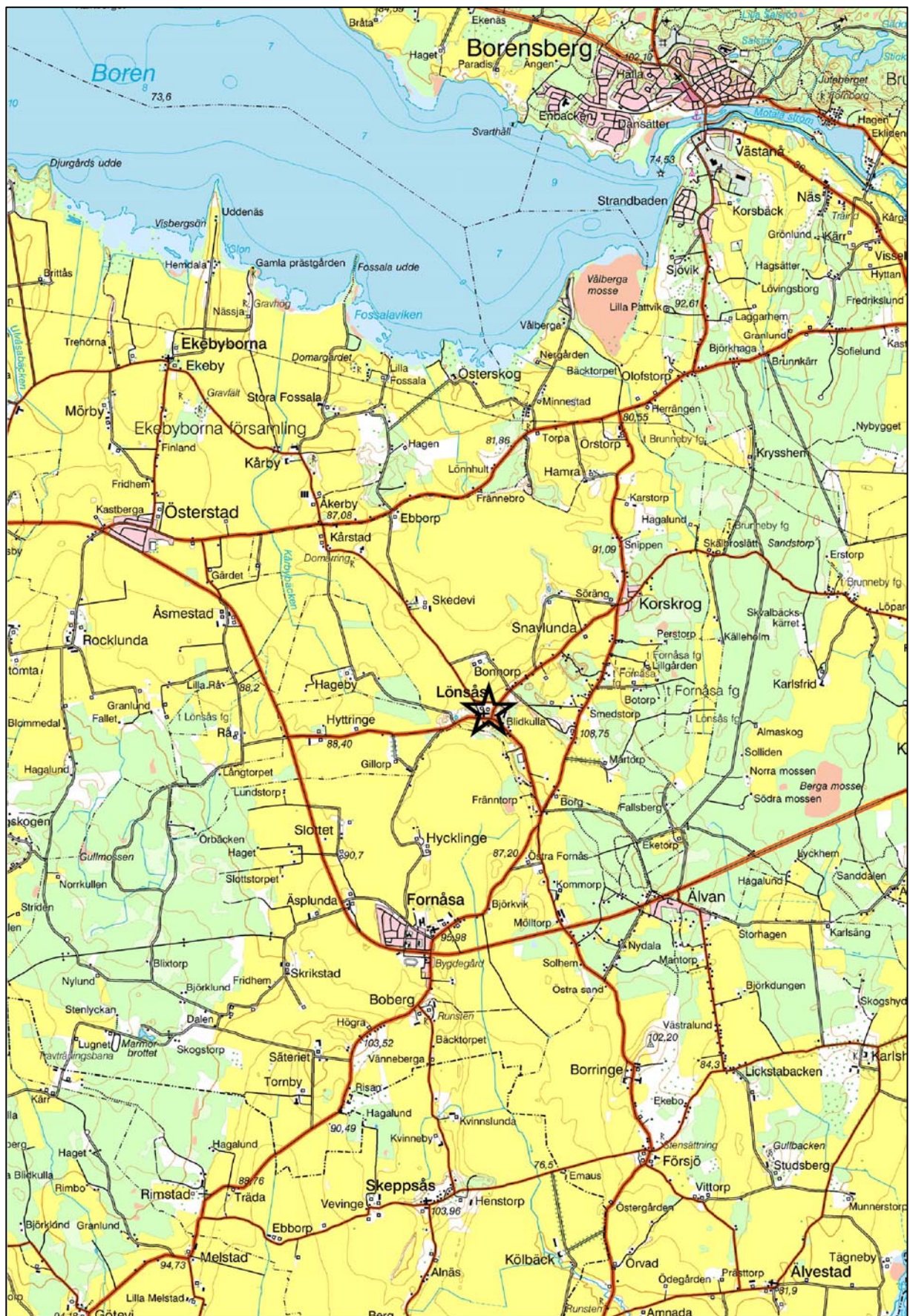
Fig 1. Utdrag ur Gröna kartan med undersökningsplatsen markerad. Skala 1:50 000.