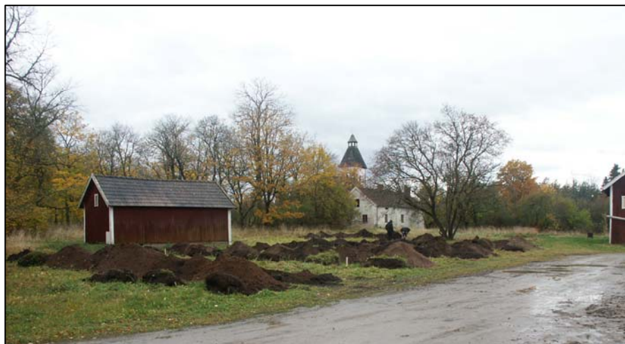
Fig 2. Sökschakten i förgrunden. 1700-tals gården och kyrkan i fonden. Från NÖ.

7 schakt togs upp där det nya huset planeras och längs med den planerade avloppsledningen. I alla schakt påträffades ett cirka 0,4-0,5 m tjockt mörkbrunt humuslager, alternativt odlingslager, som dock var tomt på anläggningar, konstruktioner eller fynd. Inga kulturlager kunde konstateras. Undergrunden bestod genomgående av sand och grus med enstaka större stenar. I ungefär hälften av schakten påträffades halvrunda mot ovala mörkfärgningar i den orörda undergrunden. Alla var helt fyndtomma och tolkades vara naturliga förändringar i marken, alternativt stenlyft.