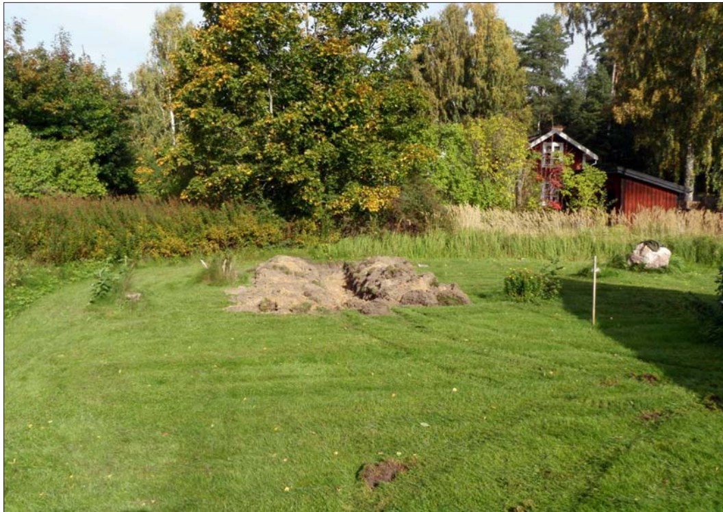
Figur 4. Det norra schaketet.