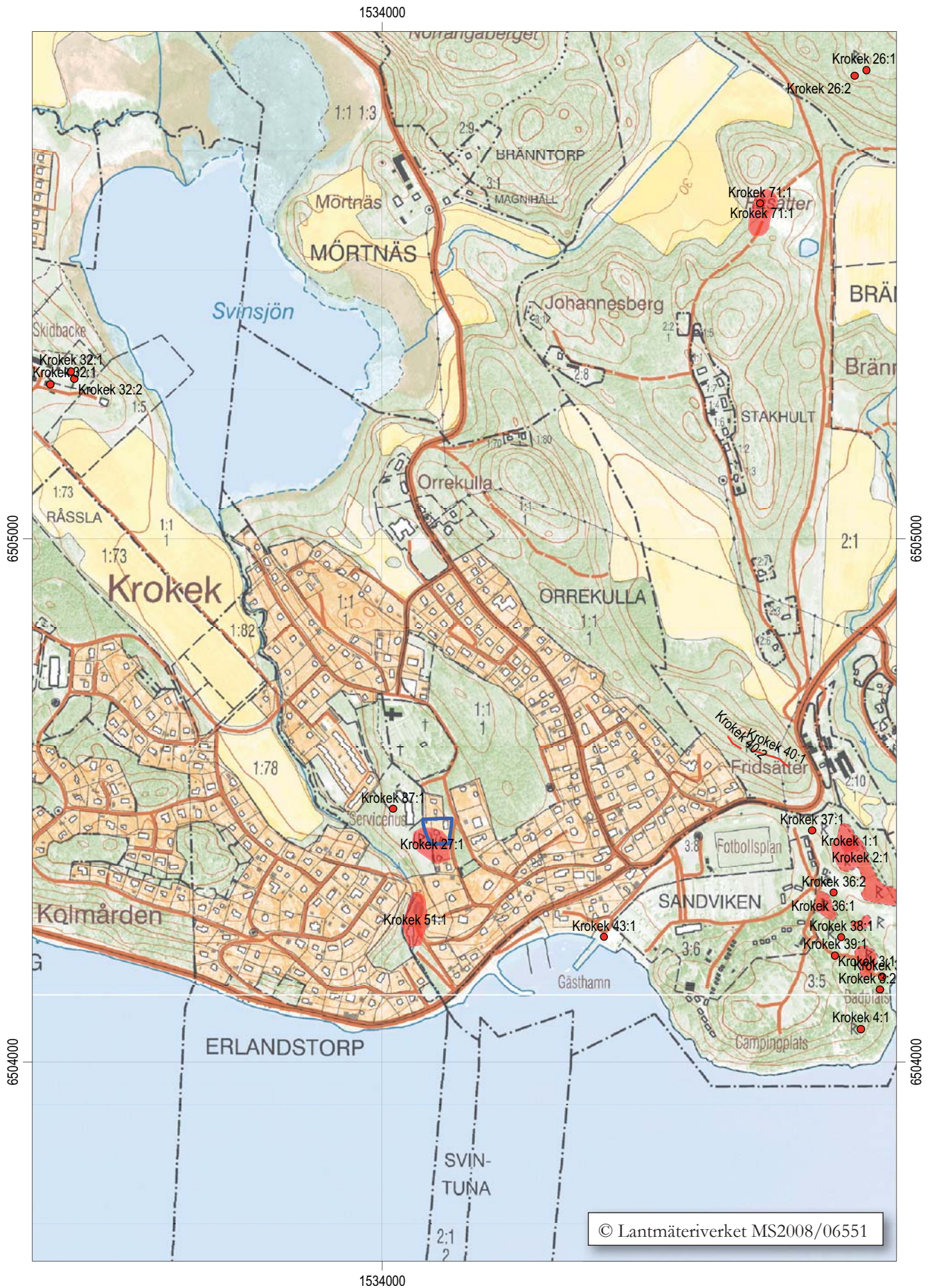
Figur 2. Utdrag ur digitala Fastighetskartan, blad 9G0g och 9G1g, med förundersökningsområdet belägenhet (blå ram) samt fornlämningsbeståndet i närområdet. Strax nordöst om RAÄ 27 ligger ytterligare en stenålderboplats, RAÄ 87. Öster om viken vid Sandviks camping ligger de kända Fagerviksboplatserna intill Marmorbruket. Dessa bildar en sekvens med allt yngre boplatser ju längre ned i backen de ligger. Skala 1:10 000.