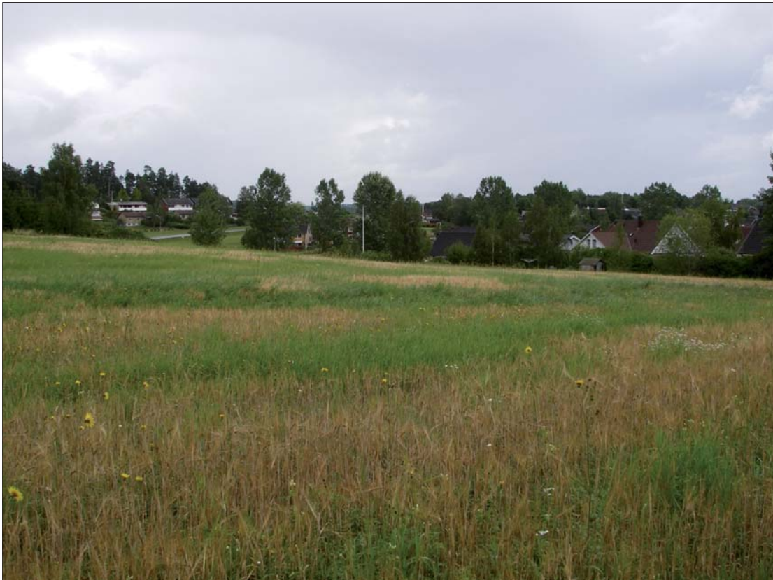
Figur 4. Foto på nördöstra delen av utredningsområdet mot nordöst.