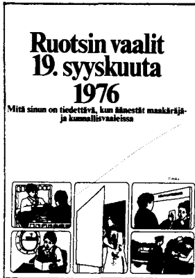
Ruotsin vaalit. (Riksskatteverket)