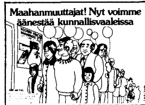
ABC — om VAL (Invandrarverket)