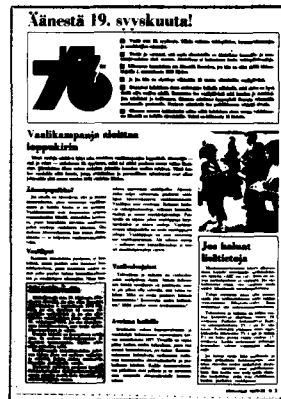
Nämä vaalisivut ovat Viikkoviestistä: