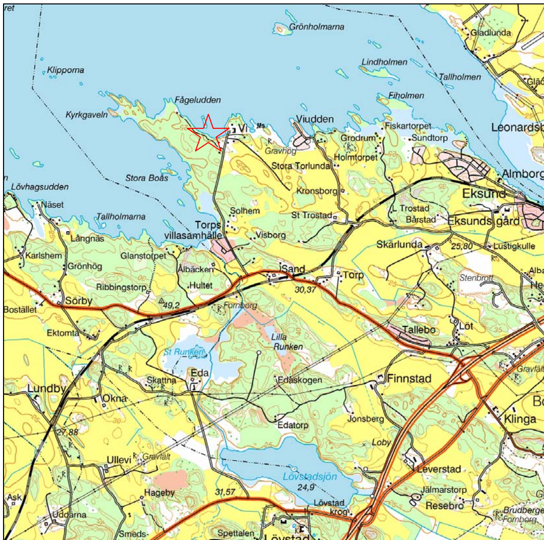
Fig 1 Utdrag ur Gröna kartan med undersökningsområdet markerat. Skala 1: 50 000.