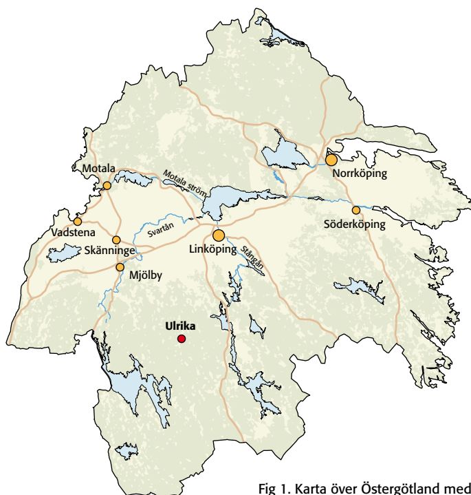
Fig 1. Karta över Östergötland med platsen för utredningen markerad.