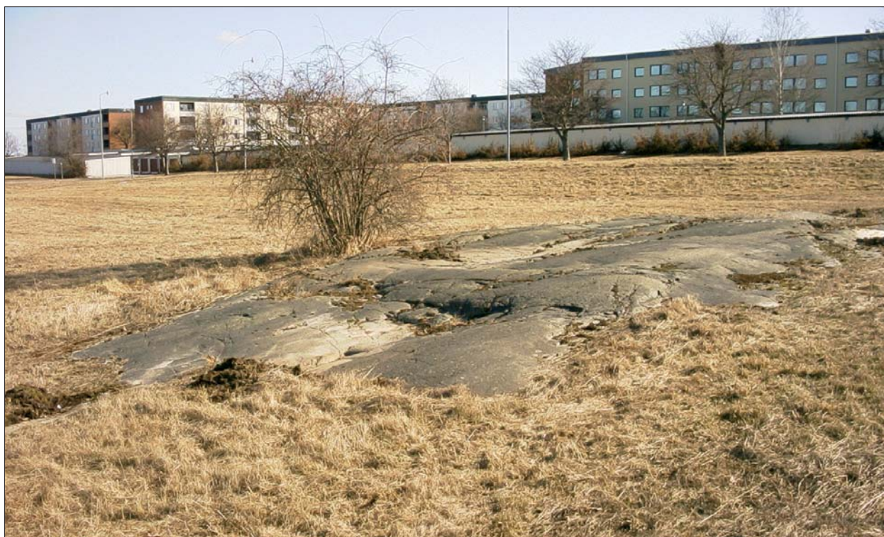
Figur 3. Berghäll inom undersökningsområdet nordost om Söderleden. Bostadsområdet Ektorp i bakgrunden.

Den aktuella arbetsytan vid Söderleden utgörs av en omkring 450 m lång sträcka med bergklackar, berg-hällar och gräsbevuxna slänter längs med nordöstra sidan av Söderleden samt en ca 100 m lång sträcka längs dess sydvästra sida. I utredningen ingår också