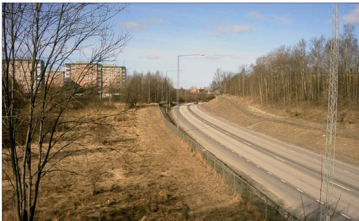
Figur 4. Undersökningsområdet vid Söderleden från öster. Bostadsområdet Vilbergen i bakgrunden.