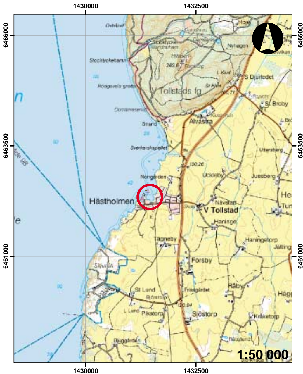
Figur 2. Utdrag ur Ekonomiska kartans blad 0 () med undersökningsområdet markerat.

Det aktuella arbetet föranleds av en planerad ut- och ombyggnad av Hästholmens hamn. Utbyggnaden kommer att ske med fast eller flytande vågbrytare och bryggplatser. Exploateringen är planerad att ske i hamnbassängen. Arbetet finansieras med EU-medel och projektet drivs av Hästholmens hamn- och kanalmagasin AB