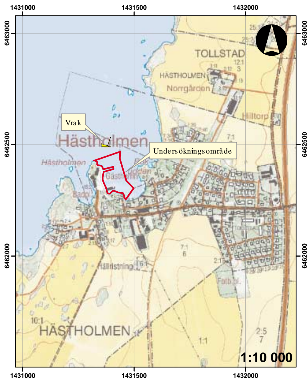
Figur 3. Utdrag ur Fastighetskartan med undersökningsområdet markerat samt den ungefärliga platsen för skeppsvraket.

Orsaken till detta är förmodligen att sanden är relativt lättflyktig och helt enkelt transporteras av vågor längre in i viken. Sandlagret varierar också relativt kraftigt inne i viken, något som bör vara ett resultat av närvaron av bryggorna och båttrafiken.